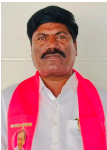
అభివృద్ధికి గండి కొడుతున్నారు.. ఉపాధి హామీ పథకంలోని 'మెటీరియల్ కాంపోనెంట్' నిధులను కేవలం కాంగ్రెస్ సర్పంచులు ఉన్న గ్రామాలకు మాత్రమే కేటా