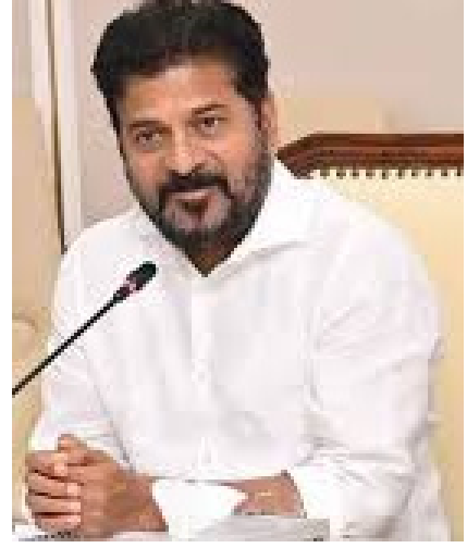
బీసీ క్యాంపు ఏర్పాటుపై అధికారులకు దిశానిర్దేశం చేయనున్నారు. సెంట్రల్ వాటర్ అండ్ పవర్ రిసెర్చ్ స్టేషన్ ఆధ్వర్యంలో జరుగుతున్న అధ్యయనం, డిసెంబర్

అక్షరదర్బార్, కాటారం : కాళేశ్వరం ఎత్తిపోతల పథకంలో కీలకమైన మేడిగడ్డ బ్యారేజీని ముఖ్యమంత్రి రేవంత్ రెడ్డి ఈనెల 20వ తేదీన సందర్శించనున్నారు. కుంగిన పిల్లలకు సంబంధించి జరుగుతున్న మరమ్మత్తు పనులను, పునరుద్ధరణ చర్యలను ఆయన స్వయంగా పర్యవేక్షించనున్నారు. ఇటీవల నీటిపారుదల శాఖపై నిర్వహించిన సమీక్షలో ముఖ్యమంత్రి మేడిగడ్డ, అన్నారం, సుందర్ల బ్యారేజీలకు యుద్ధ ప్రాతిపదికన రిపేర్లు చేయాలని అధికారులను ఆదేశించారు. నేషనల్ డ్యామ్ సేఫ్టీ అథారిటీ నివేదికలోని సిఫార్సుల మేరకు వరకాలం ప్రారంభం కాకముందే కీలక పనులు పూర్తి చేయాలని లక్ష్యంగా పెట్టుకున్నారు. -ముఖ్యమంత్రి పర్యటన ఉద్దేశం మేడిగడ్డ వద్ద కుంగిన పిల్లల ప్రాంతంలో జరుగుతున్న డ్రిల్లింగ్, శాంపిల్ సేకరణ పనులను పరిశీలిస్తారు. పనుల నిరంతర పర్యవేక్షణ కోసం మేడిగడ్డ వద్ద ప్రత్యేక