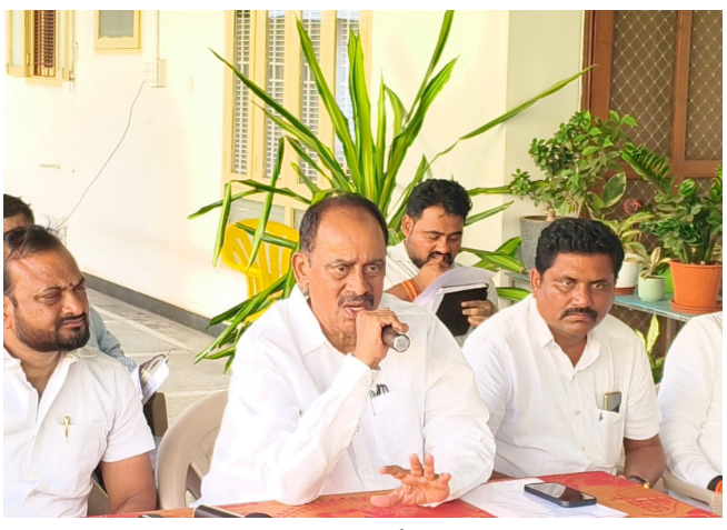
డవద్దని, భవిష్యత్తులో అందరికీ అవకాశాలు వస్తాయని ఎమ్మెల్యే పేర్కొన్నారు.

అక్షర దర్బార్, పరకాల: కష్టపడ్డ ప్రతి కాంగ్రెస్ కార్యకర్తకు గుర్తింపు, గౌరవం వచ్చేలా కృషి చేస్తామని పరకాల ఎమ్మెల్యే రేపూరి ప్రకాశ్ రెడ్డి పేర్కొన్నారు. మంగళవారం హనుమకొండ భవన నిగర్లోని ఎమ్మెల్యే క్యాంపు కార్యాలయంలో పరకాల నియోజకవర్గ పరిధిలోని సమన్వయ కమిటీ సభ్యులు, ముఖ్య నాయకులతో సమీక్ష సమావేశం నిర్వహించారు. ఈ సందర్భంగా ఆయన మాట్లాడుతూ కాంగ్రెస్ ప్రజా ప్రభుత్వ సంక్షేమ పథకాలను విస్తృతంగా ప్రచారం చేసి ప్రజల్లోకి తీసుకెళ్లాలని సూచించారు. మండల, గ్రామ అధ్యక్షుల పదవులకు ఎవరికీ అవకాశం వచ్చినా గౌరవించాలని, గ్రామాల్లో ప్రతి కార్యకర్త అభిప్రాయాలను పరిగణనలోకి తీసుకోవాలని తెలిపారు. జనాభా, కులాల మెజార్టీ ఆధారంగా పార్టీ కమిటీలు ఏర్పాటు చేయాలని సూచించారు. పార్టీని విమర్శిస్తేనే నాయకులు అవుతారనే భావన సరైది కాదని, అలాంటి ఆలోచనలు వ్యక్తిత్వాన్ని దెబ్బతీస్తాయని అన్నారు. అవకాశం రాని వారు నిరుత్సాహప