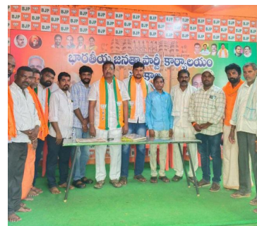
దని, వెంటనే మక్కజొన్న, పరి ధాన్యం కొనుగోళ్లు ప్రారంభించాలని రాష్ట్ర ప్రభుత్వాన్ని డిమాండ్ చేశారు. అనంతరం పశ్చిమ బెంగాల్,