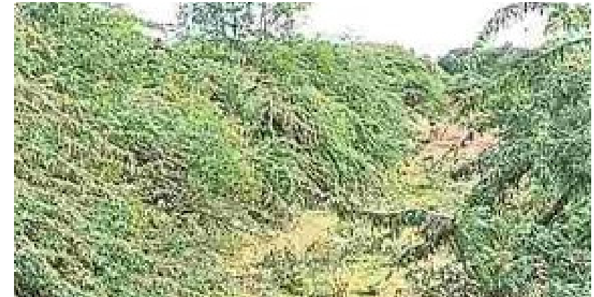
వాపోతున్నారు. వానాకాలం పంటల సాగు ప్రారంభం కానున్న నేపథ్యంలో, సాగునీటి అవసరాల దృష్ట్యా తక్షణమే పూడికతీత పనులు చేపట్టాలని కోరుతున్నారు.

అక్షర దర్శి, శాయంపేట: శాయంపేట మండలంలోని వివిధ గ్రామాల్లో సాగునీరు అందించే ఎస్సారెస్సీ ఉప కాలువలు అధ్వాన స్థితికి చేరాయి. కాలువల్లో భారీగా పేరుకుపోయిన మట్టి, ఇసుక మేటలు, బండరాళ్లు మరియు పిచ్చి చెట్ల కారణంగా నీటి ప్రవాహానికి తీవ్ర అంతరాయం ఏర్పడుతోంది. దీంతో కాలువ పొడవునా నీరు సాఫీగా సాగక, చివరి భూములకు చుక్క నీరు అందడం లేదని రైతులు ఆవేదన వ్యక్తం చేస్తున్నారు. గతంలో కురిసిన వరాలకు వాగుల నుండి వచ్చిన వరదతో కాలువలు పూడిపోయాయని, ముళ్ల పొదలు పెరిగి కాలువలు ఆనవాళ్లు కోల్పోతున్నాయని రైతులు