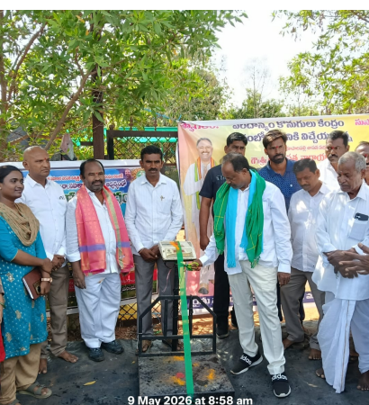
9 May 2026 at 8:58 am