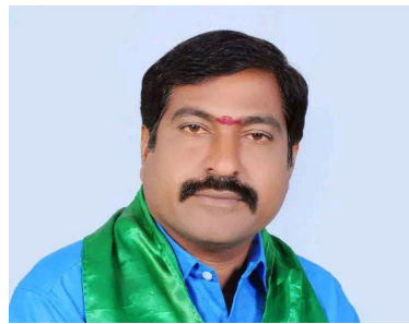
చల్లాయని తెలంగాణ రైతు రక్షణ సమితి ఉమ్మడి

అక్షర దర్బార్, పరకాల: కేంద్ర ప్రభుత్వం 2026-27 ఖరీఫ్ సీజన్కు ప్రకటించిన కనీస మద్దతు ధరలు (ఎంఎస్పీ) రైతుల ఆశలపై నీళ్లు