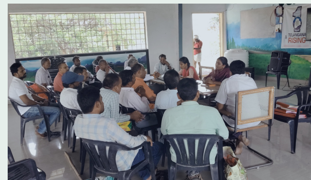
ప్రభుత్వం అనుమతించిన నాణ్యమైన విత్తనాలను మాత్రమే రైతులకు విక్రయించాలన్నారు. నిర్ణయం అమ్మితే కఠిన చట్టపరమైన చర్యలు ఉంటాయని స్పష్టం చేశారు.