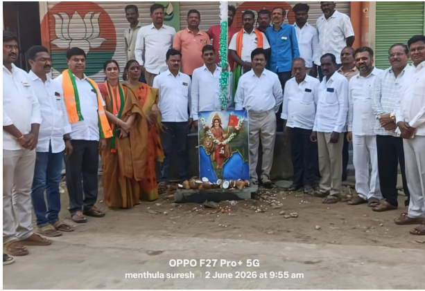
OPPO F27 Pro+ 5G menthula suresh | 2 June 2026 at 9:55 am