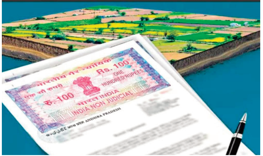
జనాల దృష్ట్యా పెంపును నియంత్రించారు. రిజిస్ట్రేషన్ చార్జీలు పెరగవు

ఆక్షర దర్బార్, హైదరాబాద్ : సవరించిన భూముల మార్కెట్ విలువలు శుక్రవారం నుంచి రాష్ట్రవ్యాప్తంగా అమల్లోకి రానున్నాయి. ఈ మేరకు రాష్ట్ర రెవెన్యూ శాఖ మంత్రి పొంగులేటి శ్రీనివాస్ రెడ్డి అధికారికంగా వెల్లడించారు. ముఖ్యమంత్రి ఎ. రేవంత్ రెడ్డి ఆలోచనల మేరకు, ప్రముఖ ఆర్థిక నిపుణుడు అరవింద్ సుబ్రమణ్యం ఇచ్చిన నివేదిక ఆధారంగా, క్షేత్రస్థాయి పరిస్థితులను విస్తృతంగా అధ్యయనం చేసి ఈ నిర్ణయం తీసుకున్నట్లు మంత్రి తెలిపారు. గత ప్రభుత్వాల హయాంలో జరిగిన లోపాలను సరిదిద్దుతూ, ఈసారి ధరల సవరణను అత్యంత శాస్త్రీయంగా, హేతుబద్ధంగా చేపట్టామన్నారు. మార్కెట్ పరిస్థితులకు అనుగుణంగా కొత్త విలువలను నాలుగు కేటగిరీలుగా వర్గీకరించినట్లు అధికారిక పర్చాల తెలిపాయి. వ్యవసాయ, అపార్ట్మెంట్లు, ఓపెన్ ప్లాట్లన్నింటికీ ఈ కొత్త ధరలు వర్తిస్తాయి. అయితే సామాన్యులపై, రియల్ ఎస్టేట్ రంగంపై అదనపు భారం పడకుండా ఉండటం కోసం ముఖ్యమంత్రి రేవంత్ రెడ్డి ఆదేశాల మేరకు ధరల పెంపుపై గరిష్టంగా 100 శాతం పరిమితి విధించారు. కొన్ని ప్రధాన నగర ప్రాంతాల్లో ఓపెన్ మార్కెట్ ధరలకు, ప్రభుత్వ ధరలకు 500 శాతం నుండి 600 శాతం వ్యత్యాసం ఉన్నప్పటికీ ప్రజల ప్రయో