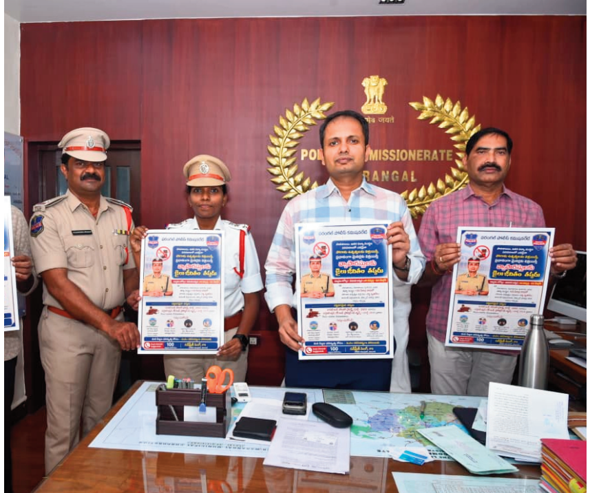
చెడు అలవాట్లకు బానిసలుగా మారకుండా చేపడుతున్న చర్యల్లో భాగంగా విద్యా సంస్థల పరిసరాల్లో పొగాకు విక్రయాలు నిషేధించబడాయని ఆయన పేర్కొన్నారు. ఎవరైనా విద్యా సంస్థల వద్ద విక్రయాలకు పాల్పడితే సిగరెట్ అండ్ అదర్ టోబాకో ప్రొడక్ట్స్ - 2003 యాక్ట్ క్రింద చర్యలు తీసుకోబడుతాయని, మైసర్లకు పొగాకు ఉత్పత్తులు విక్రయిస్తే జైల్లో జువెనైల్ యాక్ట్ 2015 యాక్ట్ 77 ప్రకారం చట్ట పరమైన చర్యలు తీసుకోవడం

ఆక్షరదర్శి, హనుమకొండ: వ్యాపారులు ఎవరైనా పాఠశాల, కళాశాల, ఇతర విద్యా సంస్థల పరిసరాల్లో పొగాకు ఉత్పత్తులు విక్రయిస్తే జైలు జీవితం తప్పదని వరంగల్ పోలీస్ కమిషనర్ సన్ ప్రీత్ సింగ్ హెచ్చరించారు. మరీ కొన్ని రోజుల్లో కొత్త విద్యా సంవత్సరం ప్రారంభం కానుంది. ఇప్పటికే ప్రభుత్వ, ప్రైవేటు పాఠశాలలు రిజిస్ట్రేషన్ కు సిద్ధమవుతున్నాయి. అయితే, స్కూళ్లు, కాలేజీల పరిసరాల్లోని పాన్ షాపులు, ఇతర దుకాణాలు సూడెంట్లను చెడు అలవాట్ల వైపు మళ్లిస్తున్నాయనే ఆందోళనలు వ్యక్తమవుతున్నాయి. గుట్టా, సిగరెట్ల తదితర పొగాకు ఉత్పత్తులను విక్రయించడం ద్వారా విద్యార్థులు మాదక ద్రవ్యాలకు అలవాటు పడే ప్రమాదం ఉందని పోలీసులు భావిస్తున్నారు. ఈ నేపథ్యంలో విద్యార్థుల భవిష్యత్తును దృష్టిలో పెట్టుకుని రాష్ట్ర ప్రభుత్వ ఆదేశాల మేరకు వరంగల్ కమిషనరేట్ పరిధిలో 'ఆపరేషన్ సేఫ్ స్కూల్' పేరుతో విస్తృత తనిఖీలు నిర్వహిస్తున్నారు. మైసర్లు, స్కూల్ సూడెంట్లకు గుట్టా, సిగరెట్ల వంటి పొగాకు ఉత్పత్తులు అమ్మకుండా విద్యా సంస్థల సమీపంలోని పాన్ షాపులు, ఇతర దుకాణాలను తనిఖీ చేస్తున్నారు. కొత్త విద్యాసంవత్సరం ప్రారంభమయ్యే నాటికి స్కూళ్లు, కాలేజీల పరిసరాలను టోబాకో ఫ్రీ జోన్లుగా మార్చేందుకు వరంగల్ పోలీస్ కమిషనర్ ఆధ్వర్యంలో పోలీసులు చర్యలు తీసుకొనేందుకు సిద్ధమయ్యారు. ఇందులో భాగంగా విద్యా సంస్థల పరిసరాల్లో పొగాకు ఉత్పత్తులను నిషేధించే తెలియజేస్తూ రూపొందించిన గోడ పత్రాలను సీటీ గురువారం ఆవిష్కరించారు. ఈ సందర్భంగా విద్యార్థుల భవిష్యత్తును కాపాడాల్సిన బాధ్యత మనందరిపై ఉందని, ముఖ్యంగా విద్యార్థులు