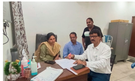
ఉన్నాయి అని తెలిపారు అన్ని ఆసుపత్రులలో విధిగా తనిఖీలు నిర్వహిస్తామని తెలియజేశారు.