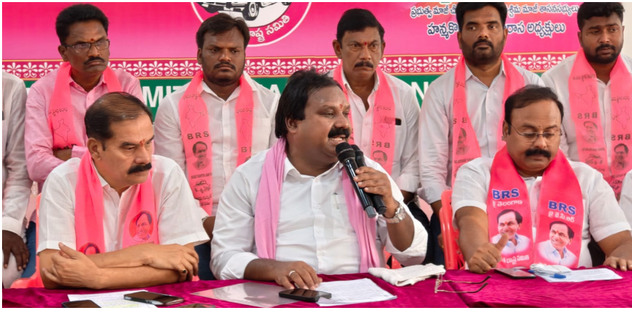
సర్కార్ పై ఆయన మండిపడ్డారు. రైతును రాజును చేసిన మహనీయుడు కేటీఆర్

కాంగ్రెస్ వైఫల్యాలపై నిప్పులు చెరిగిన మాజీ ఎమ్మెల్యే అరూరి అక్షరదర్శాల్, హనుమకొండ: కాంగ్రెస్ ప్రభుత్వం రైతులను నట్టేట ముంచుతోందని, ఎన్నికల ముందు ఇచ్చిన హామీలను విస్మరించి అన్నదాతలను గోస పెడుతోందని వర్షన్నపేట మాజీ ఎమ్మెల్యే అరూరి రమేష్ ధ్వజమెత్తారు. శనివారం హనుమకొండ జిల్లా బీఆర్ఎస్ కార్యాలయంలో వర్షన్నపేట నియోజకవర్గ బీఆర్ఎస్ పార్టీ బీఎల్ఎం సభ్యుల శిక్షణా తరగతులు, కాంగ్రెస్ ప్రభుత్వ వైఫల్యాలపై ప్రెస్ మీట్ ఆయన మాట్లాడారు. ఈ నెల 22న సత్సాయి కన్వెన్షన్ హాల్లో వర్షన్నపేట నియోజకవర్గానికి చెందిన బీఎల్ఎం, సభ్యత్వ నమోదు ప్రతినిధులు, సోషల్ మీడియా ప్రతినిధులు దాదాపు 2,500 మందితో నిర్వహించే ఒక రోజు శిక్షణా తరగతుల కార్యక్రమానికి బీఆర్ఎస్ పార్టీ వర్కింగ్ ప్రెసిడెంట్ కేటీఆర్ ముఖ్య అతిథిగా హాజరవుతారని వెల్లడించారు. ముఖ్యమంత్రి రేవంత్ రెడ్డి రైతులను ఘోరంగా మోసం చేస్తున్నారని అరూరి విమర్శించారు. "రైతుబంధును పూర్తిగా ఎగ్నోట్టారు, రైతు బీమాను బంద్ పెట్టారు, క్వింటాలుకు ఇస్తామన్న బోనస్ కాస్తా బోగస్ అయ్యింది. రైతులు పండించిన పంటలను కొనుగోలు చేసే నాభుడే కరువయ్యాడు అని కాంగ్రెస్